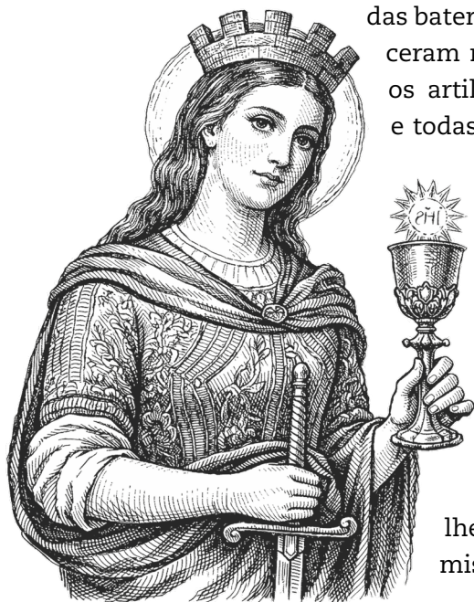
Santa Bárbara, Padroeira da Artilharia.

Santa Bárbara, os artilheiros prosseguem na missão.