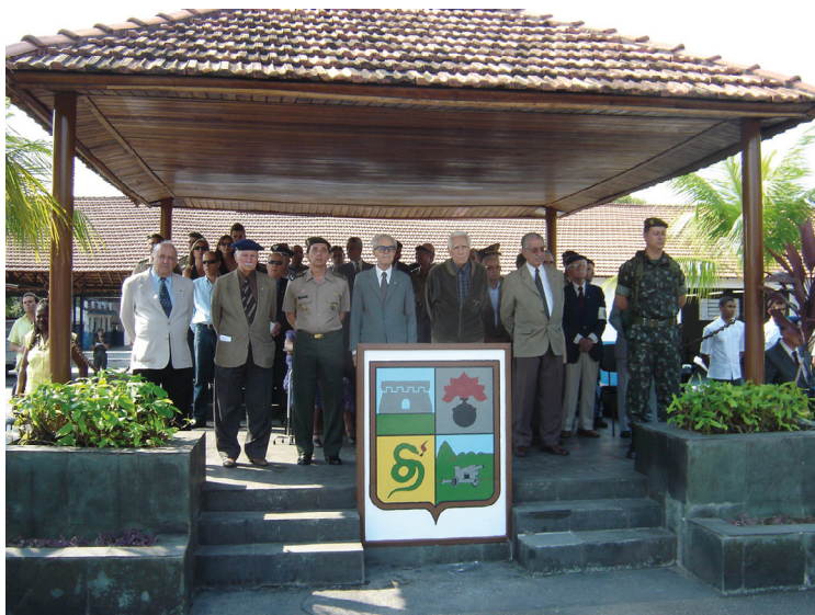
1º Tiro no 21 GAC São Cristóvão, 16 set. 2005 – General Mayer e autoridades.