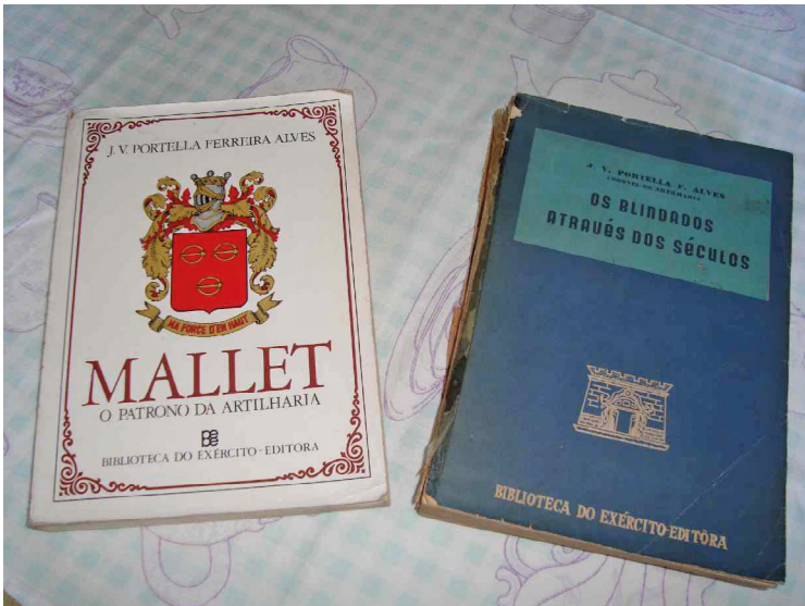
– Obras do Coronel Portella.