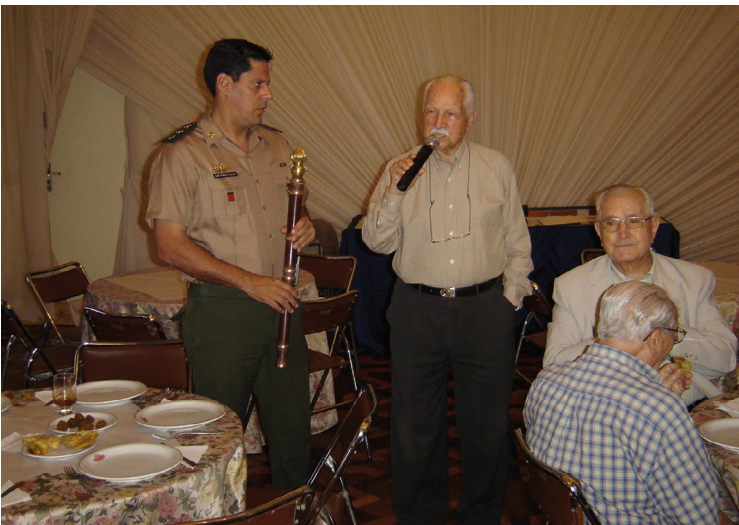
General Montagna no almoço da Ordem dos Vet Art Club Mil 2005