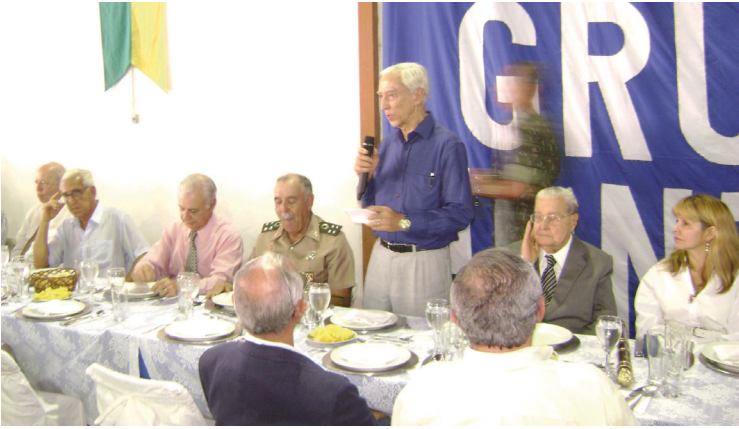
Dia da Artilharia, 11 GAC, 10 junho 2008 – General Muniz Sec O Vet Art.