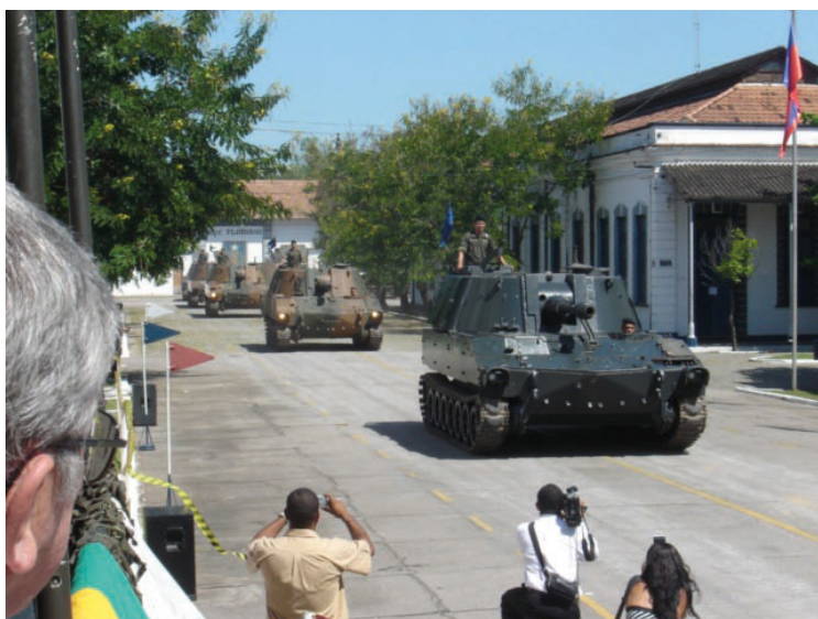
Aniversário do Regimento Floriano ainda na Vila Militar, 2005 (atual G Art Selva de Marabá/PA).