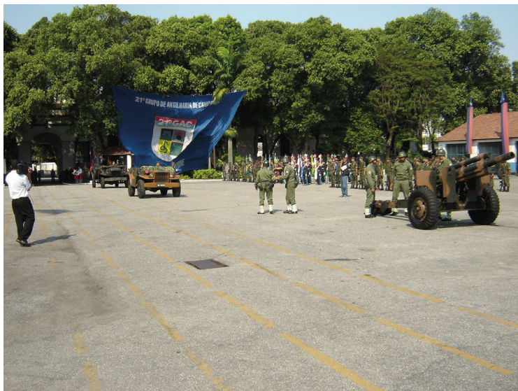
Reencenação do 1º Tiro no 21 GAC, São Cristóvão, 16 set. 2005.