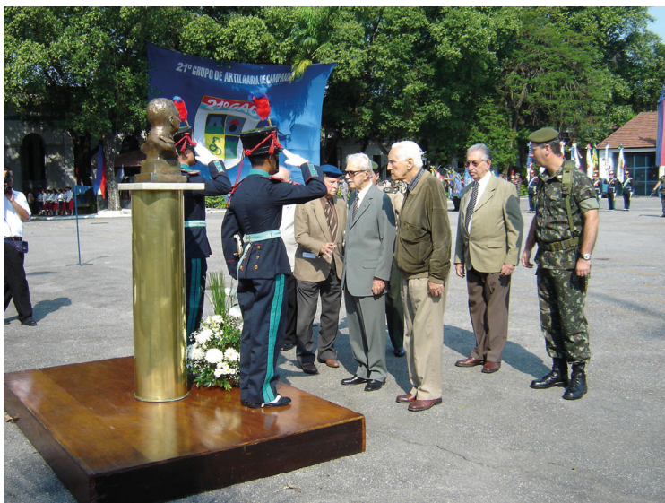
1º Tiro no 21 GAC São Cristóvão, 16 set. 2005.