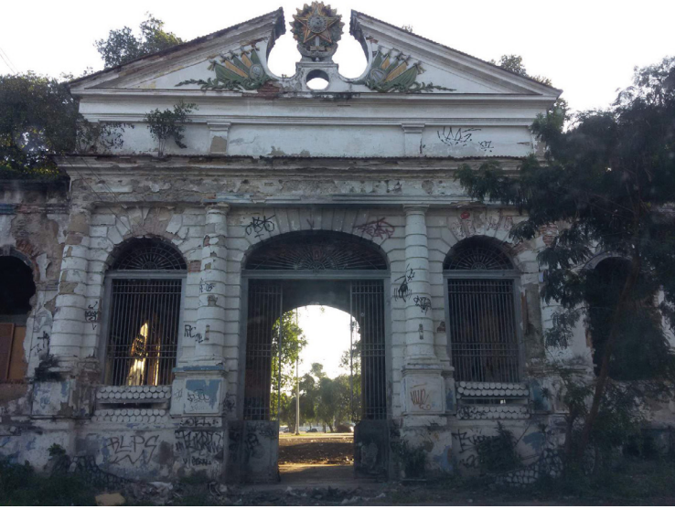
21 GAC São Cristóvão, 2017 – Portão das Armas em ruínas.