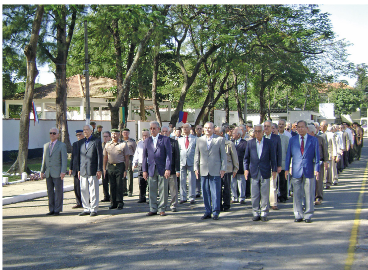
Dia da Artilharia, 11 GAC, 10 junho 2008 – Generais de Exército à frente do Grupamento da Saude.