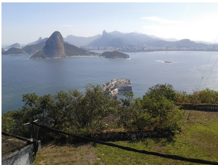
21 GAC Entrada da barra vista do Forte Barão do Rio Branco, 2017.