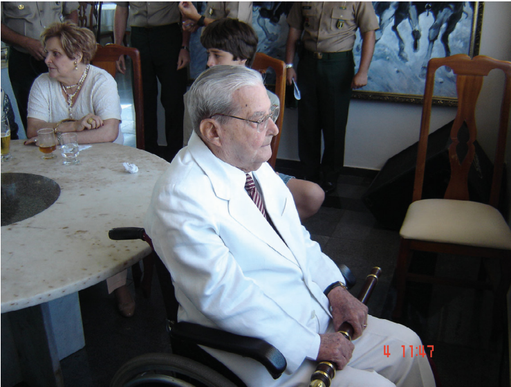
Forte Copacabana, Dia de Santa Bárbara, 4 dez. 2006 e aniversário do Marechal Levy Cardoso.