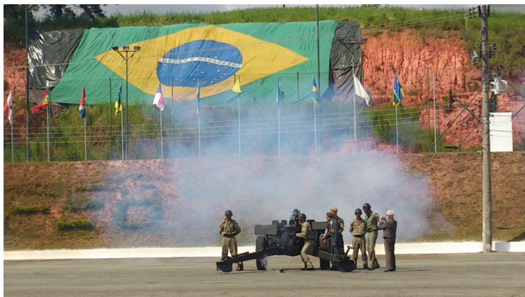
Barueri – Último Tiro, 25 abril 2012.