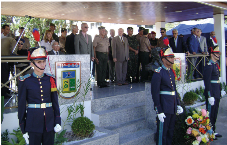
Dia da Artilharia, 11 GAC, 10 junho 2008 – Palanque das autoridades.