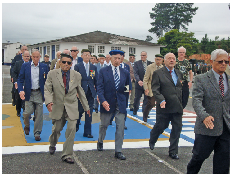
Barueri – Último Tiro, 25 abril 2012 – Coronel Amerino, General Nery e General Catão.